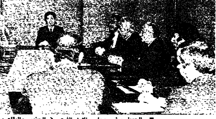
كراي يدي بتصريحه

وتحدث كافة الإجراءات التي تحول دون تعطيل دوره.